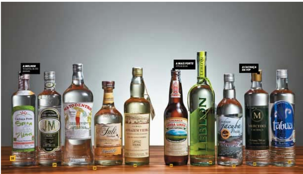
Clique na imagem para ver as informações